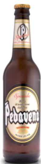
Bottiglia da 50 cl