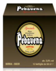
Cartonata 12 bottiglie