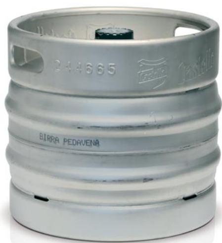
Superpremium da lt. 30

Il nome deriva dalla sua locazione geografica: la fabbrica di Pedavena, fondata nel 1897, si trova ai piedi del monte Avena. È prodotta esclusivamente con acqua oligominerale dalle sorgenti dei monti Oliveto e Porcilla, con materie prime di alta qualità, secondo l'antica tradizione birraria. È una superpremium, con un'estrazione artigianale: fatta ancora dagli uomini.